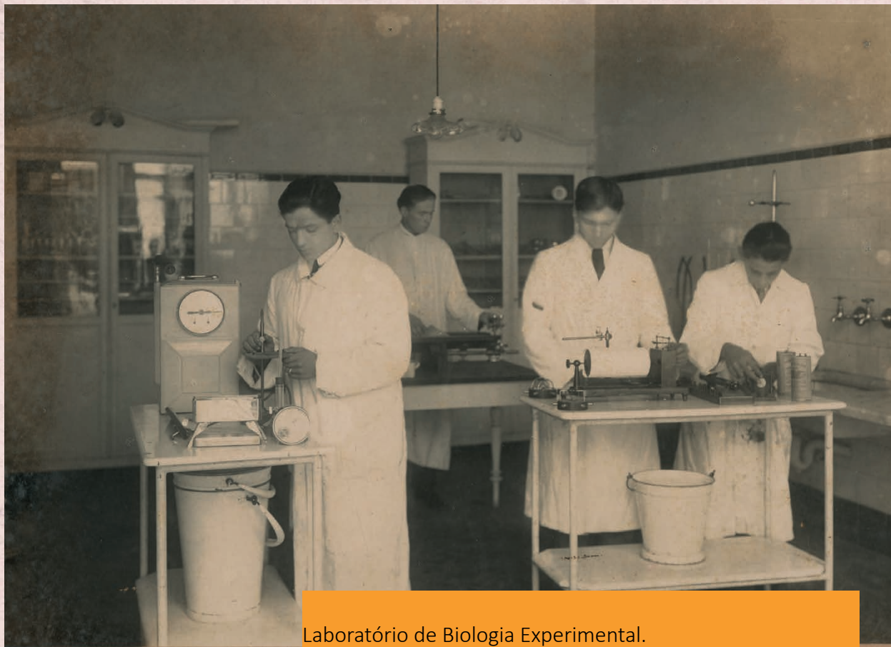
Laboratório de Biologia Experimental. Preparadores e alunos. (Universidade Livre de São Paulo) Data: (s.d.) Autor: Não identificado Código: BR APESP ICO USP-002-002/006