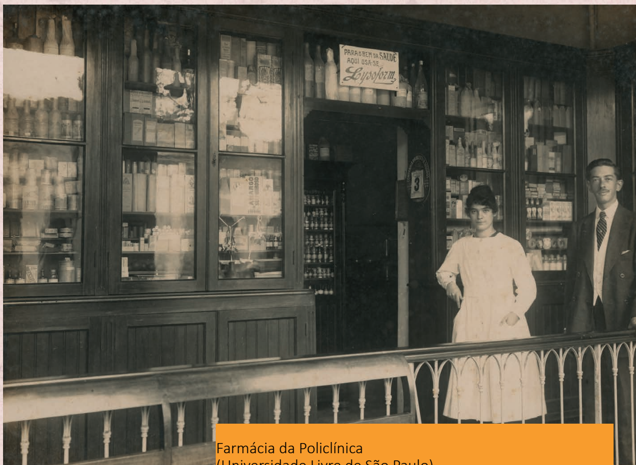
Farmácia da Policlínica (Universidade Livre de São Paulo) Data: (s.d.) Autor: Não identificado Código: BR APESP ICO USP-001-002/004