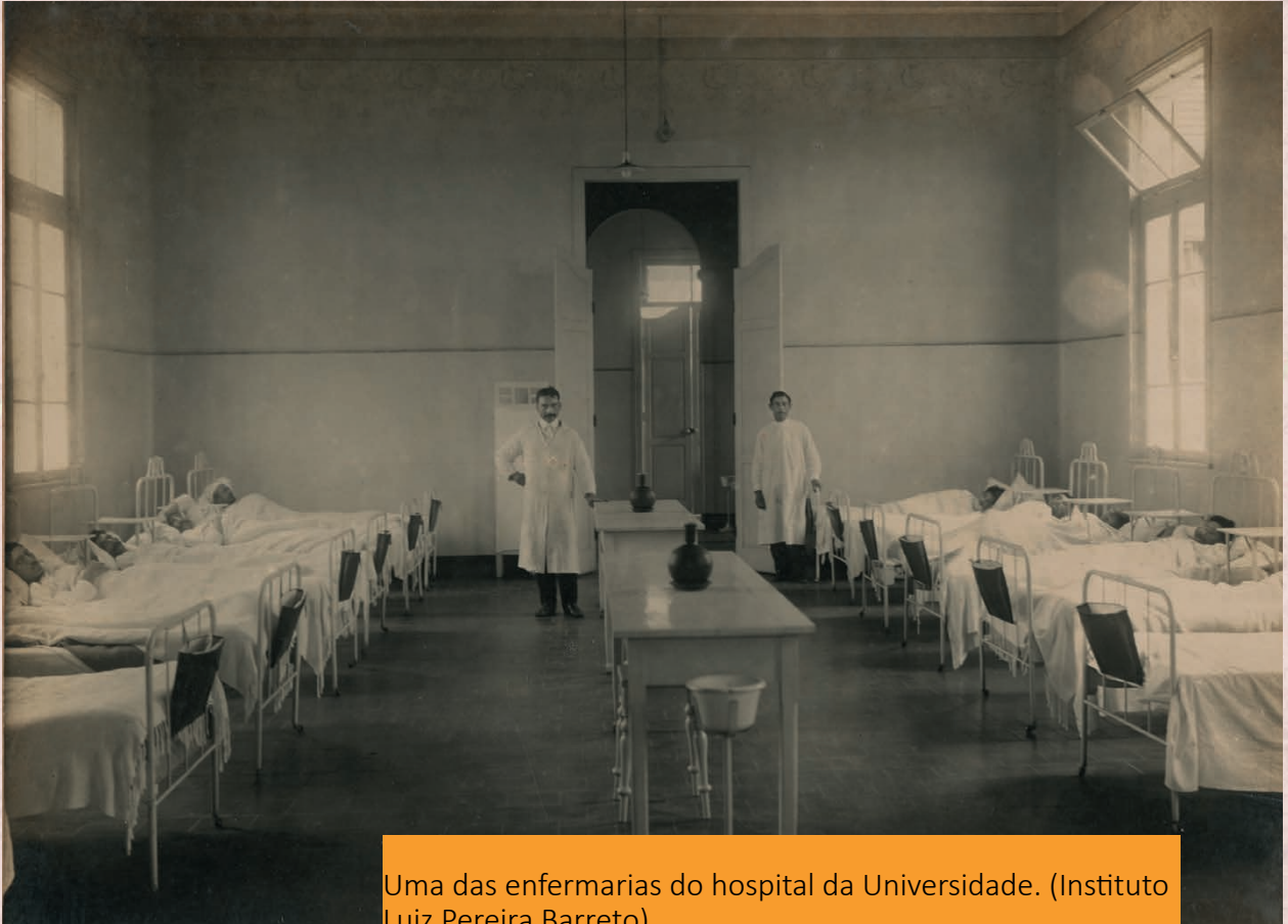
Uma das enfermarias do hospital da Universidade. (Instituto Luiz Pereira Barreto) (Universidade Livre de São Paulo) Data: s/d Código: BR APESP ICO USP-003-003/005