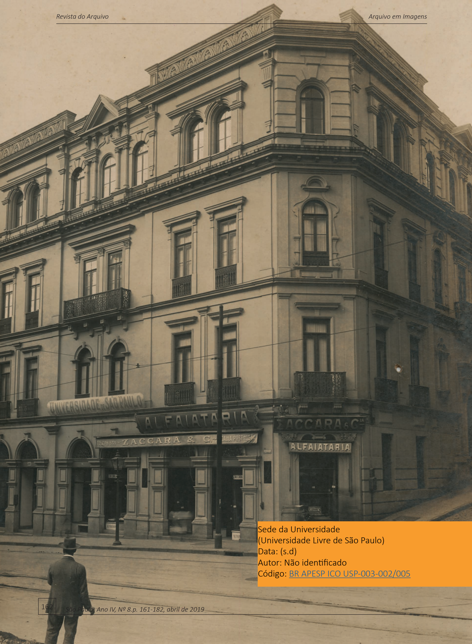
Sede da Universidade (Universidade Livre de São Paulo) Data: (s.d) Autor: Não identificado Código: BR APESP ICO USP-003-002/005