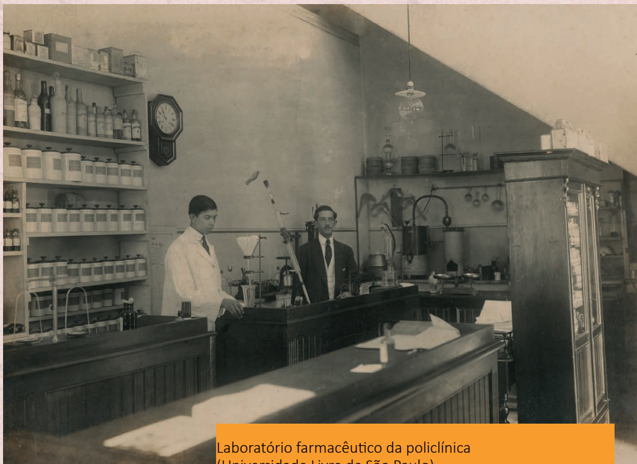
Laboratório farmacêutico da policlínica (Universidade Livre de São Paulo) Data: (s.d.) Autor: Não identificado Código: BR APESP ICO USP-001-002/005