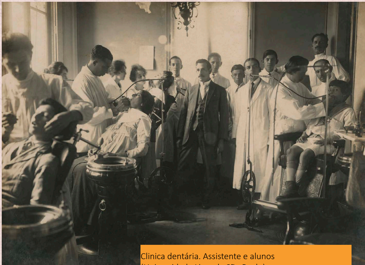
Clinica dentária. Assistente e alunos (Universidade Livre de São Paulo) Data: (s.d) Autor: Não identificado Código: BR APESP ICO USP-001-003/004