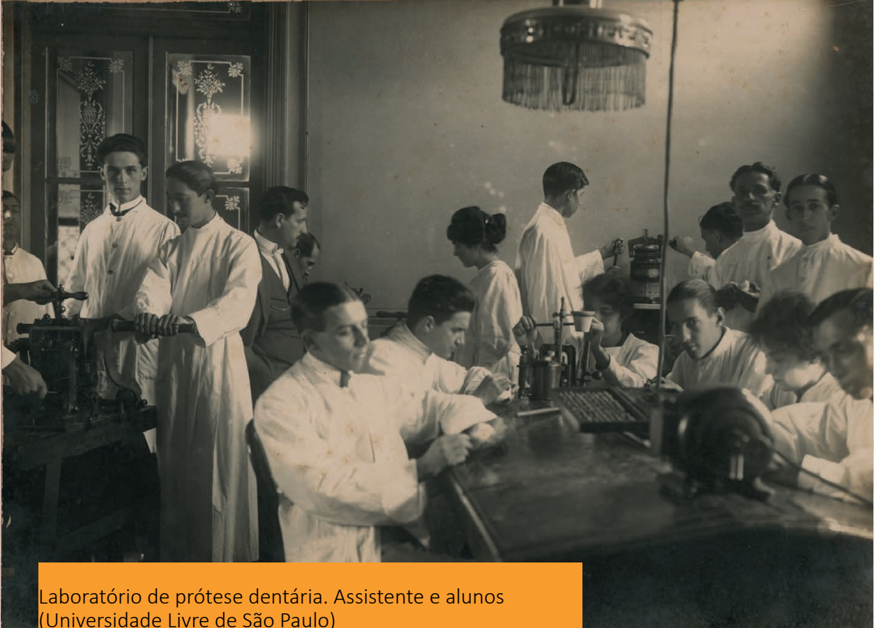
Laboratório de prótese dentária. Assistente e alunos (Universidade Livre de São Paulo)