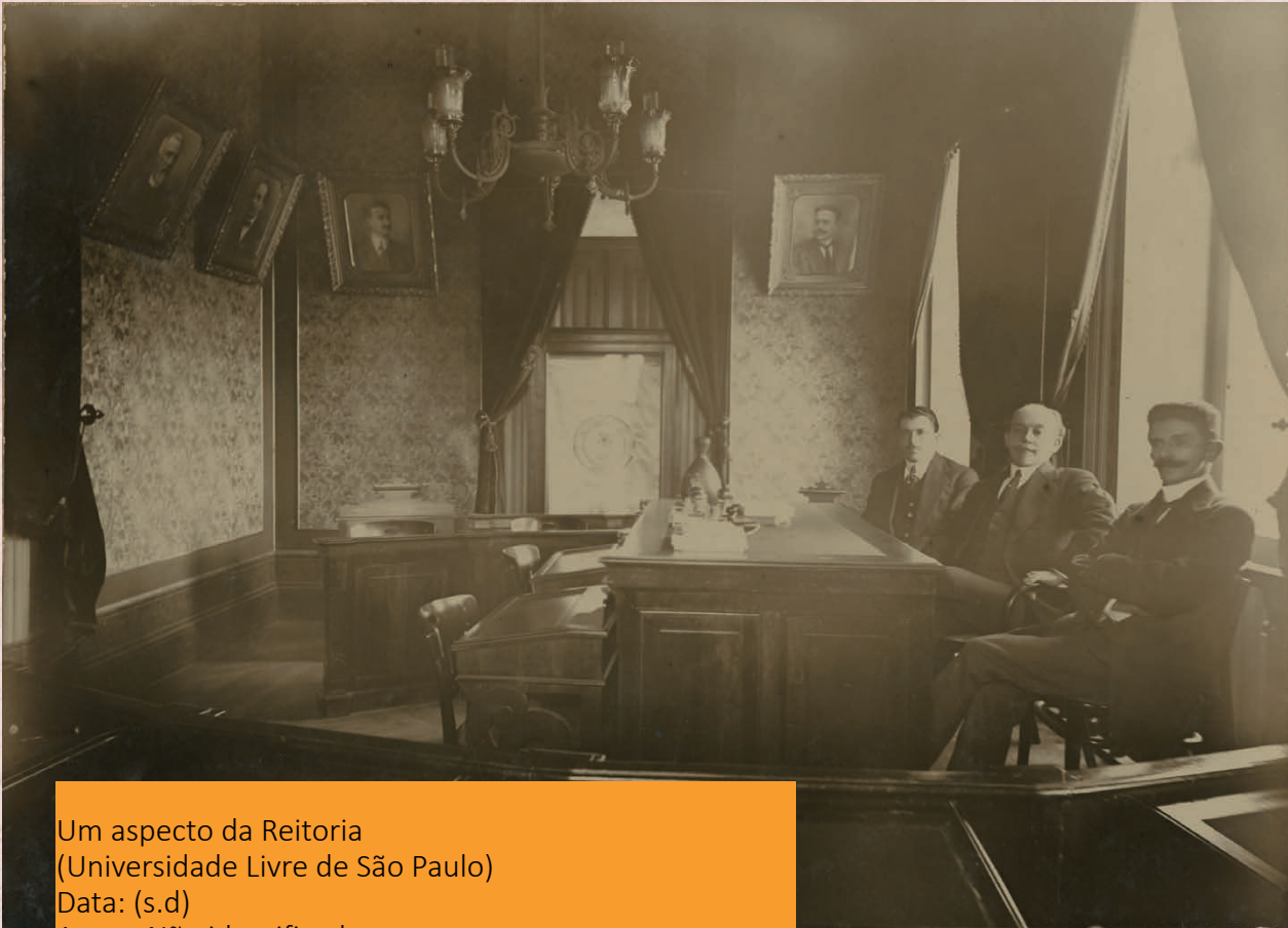
Um aspecto da Reitoria (Universidade Livre de São Paulo) Data: (s.d) Autor: Não identificado Código: BR APESP ICO USP-001-001/001