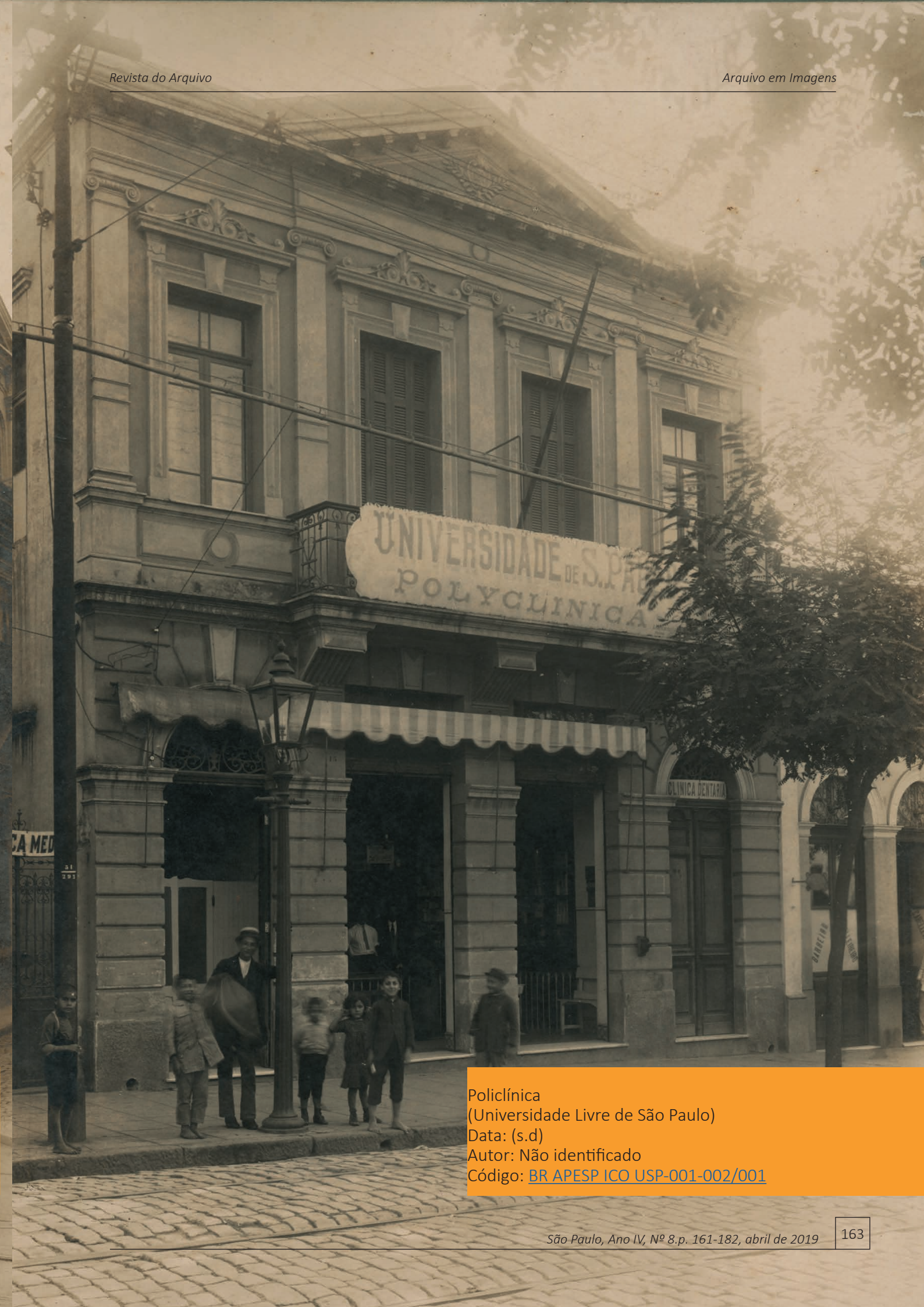
Policlínica (Universidade Livre de São Paulo) Data: (s.d) Autor: Não identificado Código: BR APESP ICO USP-001-002/001