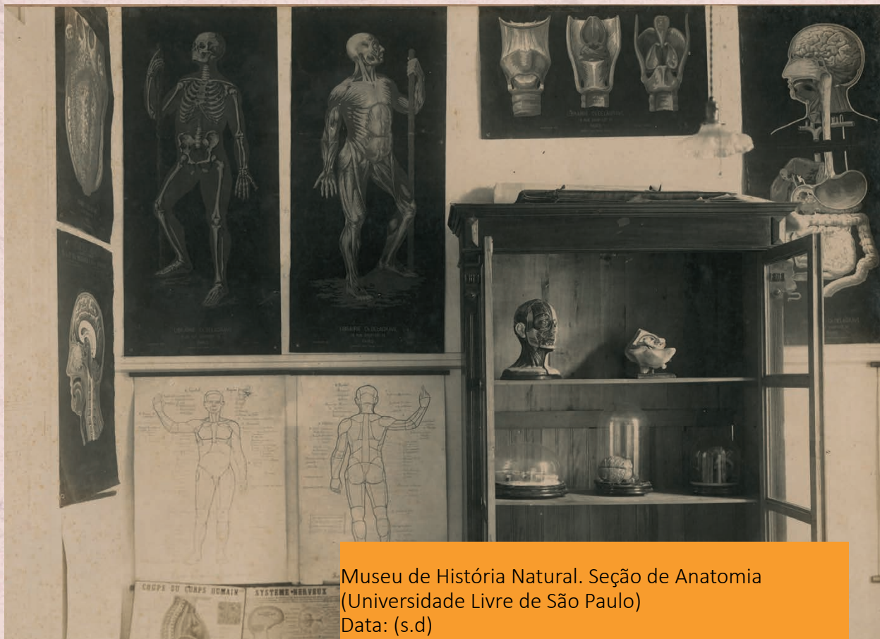
Museu de História Natural. Seção de Anatomia (Universidade Livre de São Paulo) Data: (s.d) Autor: Não identificado Código: BR APESP ICO USP-002-004/005