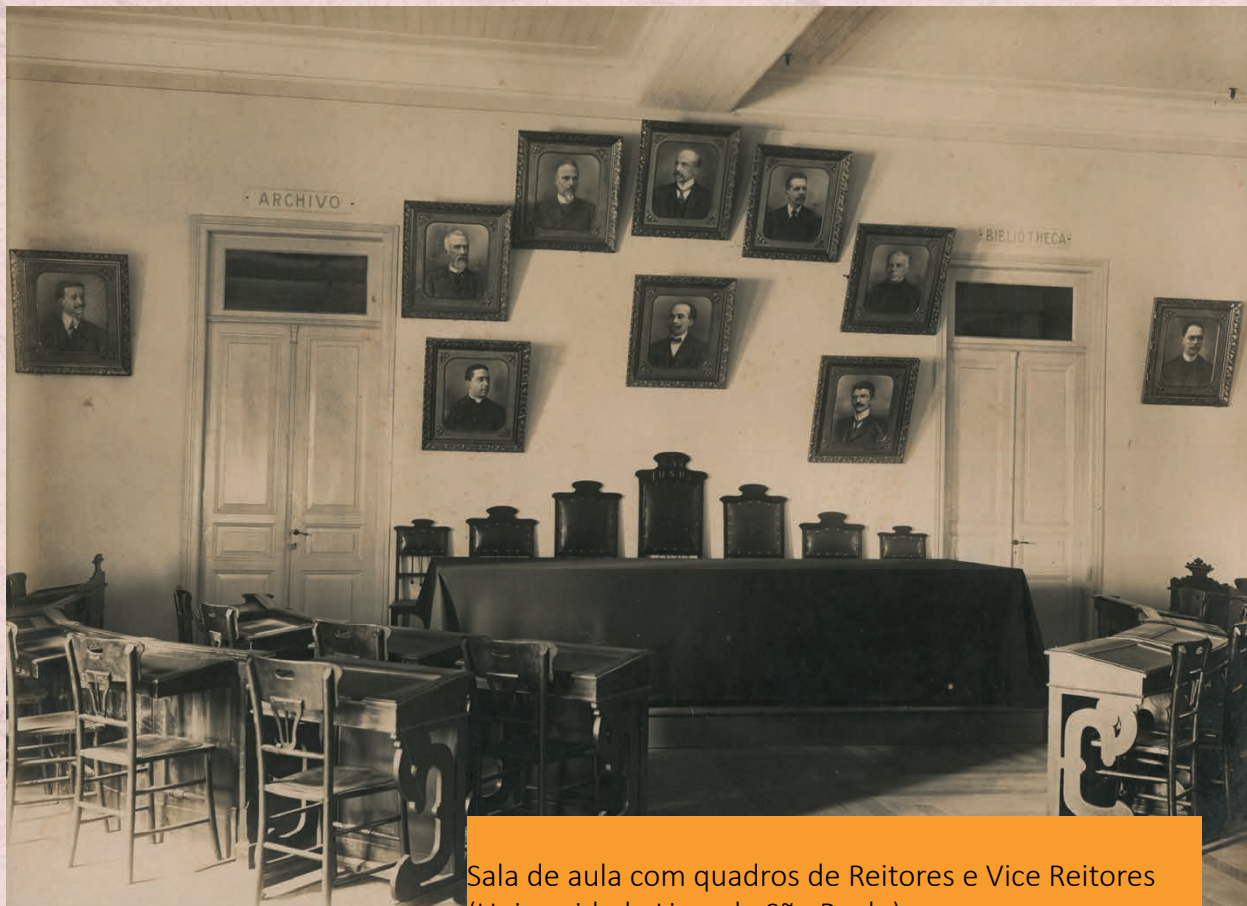
Sala de aula com quadros de Reitores e Vice Reitores (Universidade Livre de São Paulo)