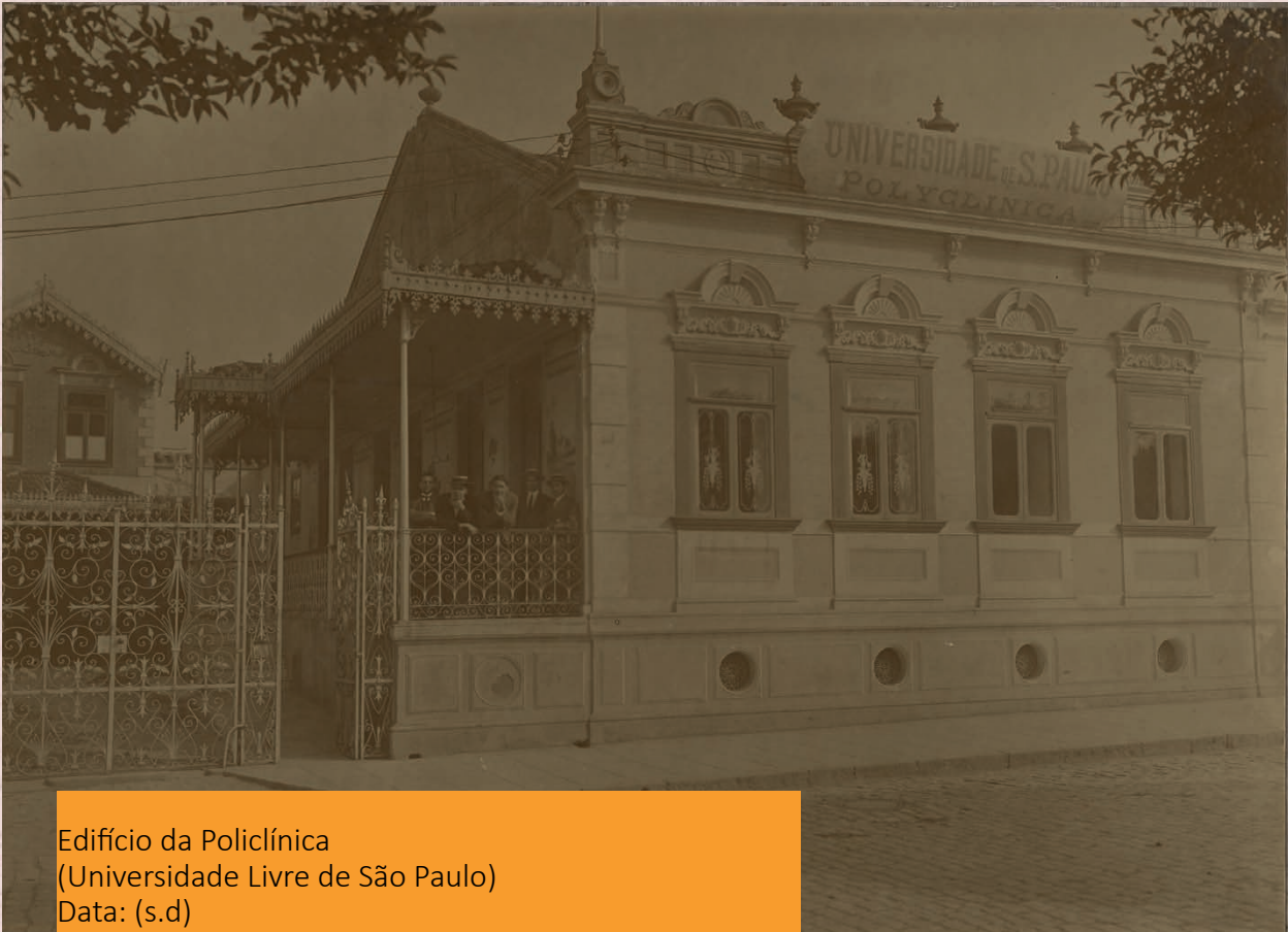
Edifício da Policlínica (Universidade Livre de São Paulo) Data: (s.d) Autor: Não identificado Código: BR APESP ICO USP-001-002/002