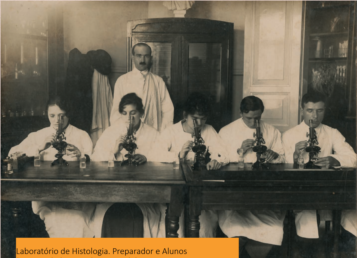
Laboratório de Histologia. Preparador e Alunos (Universidade Livre de São Paulo) Data: (s.d.) Autor: Não identificado Código: BR APESP ICO USP-002-002/001